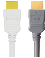
Erhältlich in Weiß (W) und Grau (H)